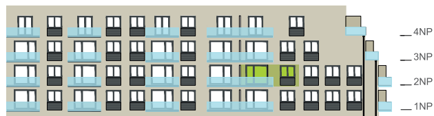
Východní pohled na dům / Building View - east side